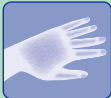
水仕事などで ガサガサの手指