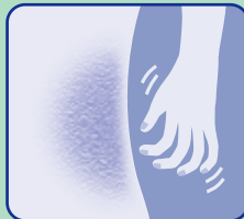
乾皮症で カサカサの肌