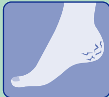
硬くぶ厚くなった カチカチかかと