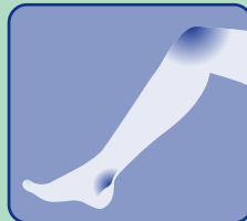
黒ずんで ザラザラ の ひじ・ひざ・くるぶし